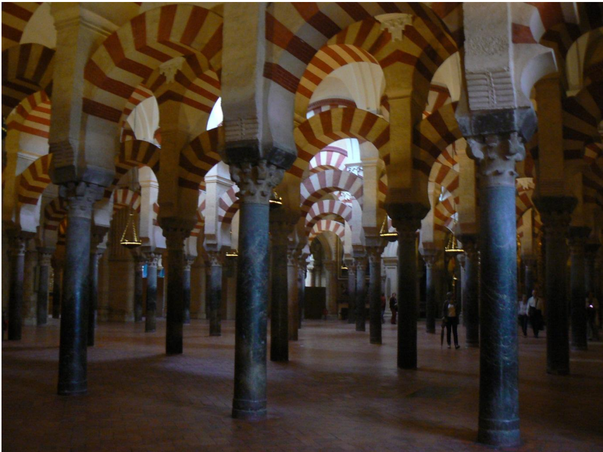
De Mezquita in Córdoba

Verwijzingen naar al-Andalus in landelijke Nederlandse dagbladen